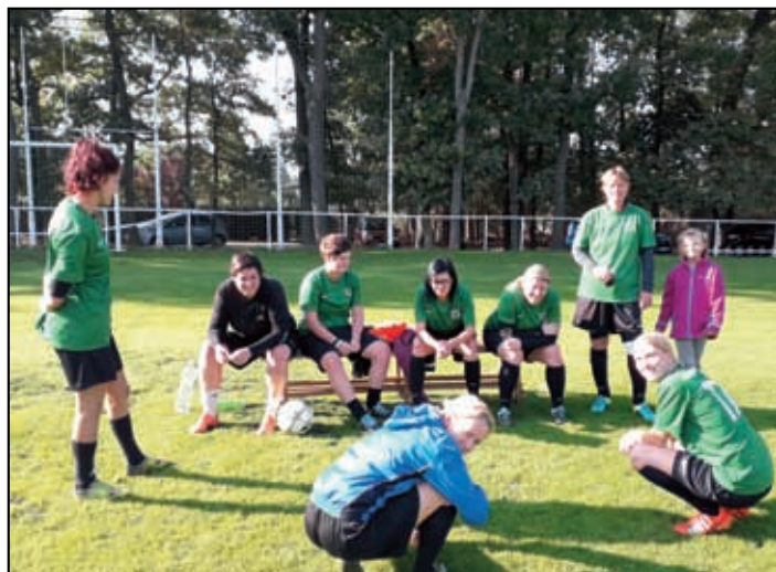
Zúčastněné ženy na turnaji SK Sahara Vědomice 2018.

Východiskem ze současné situace v týmu žen bylo využít nové možnosti ve fotbalu žen Divize - vytvořit společné družstvo s jiným účastníkem této soutěže. Nabízela se možnost s FK Teplice či FK Brňany, ale oba kluby to odmítly. Vedení Sahary sice podalo opět