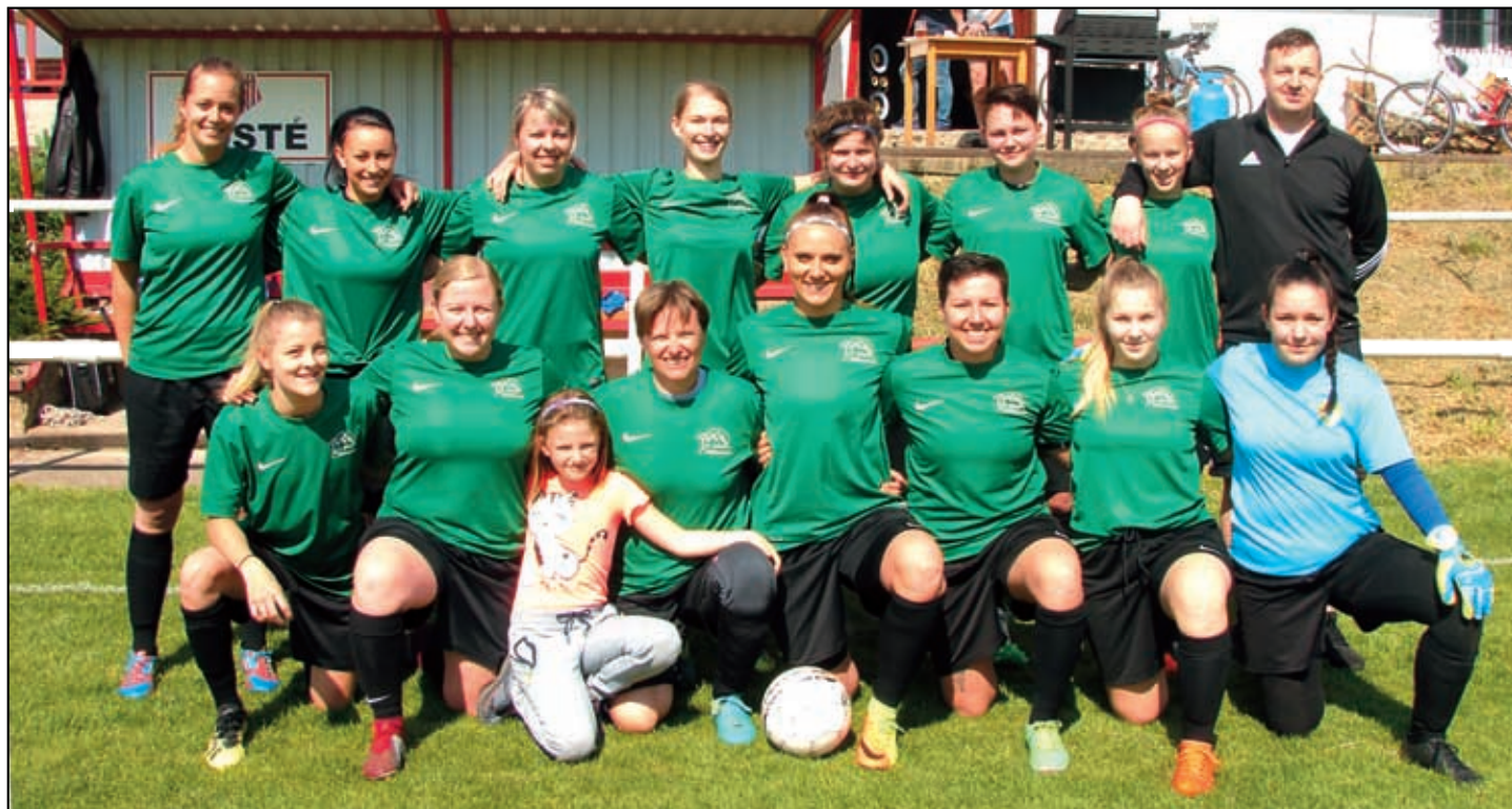
Tým žen na přátelském utkání v Brňanech dne 17.5.2020

člen výkonného výboru a vedoucí družstva žen